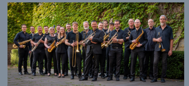
Uni Big Band